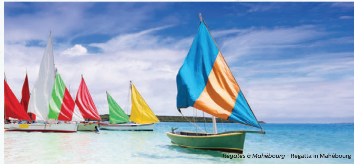
Régates à Mahébourg - Regatta in Mahébourg

The historical village of Mahébourg and its typical Mauritian atmosphere are an invitation to take a stroll in this laid-back setting. It's also the perfect place to experience how the locals live; visit the market to sample delicious Mauritian specialties, enjoy a fresh fruit salad on the seafront or lap up the sight of a 'pirogue regatta' along the coast.