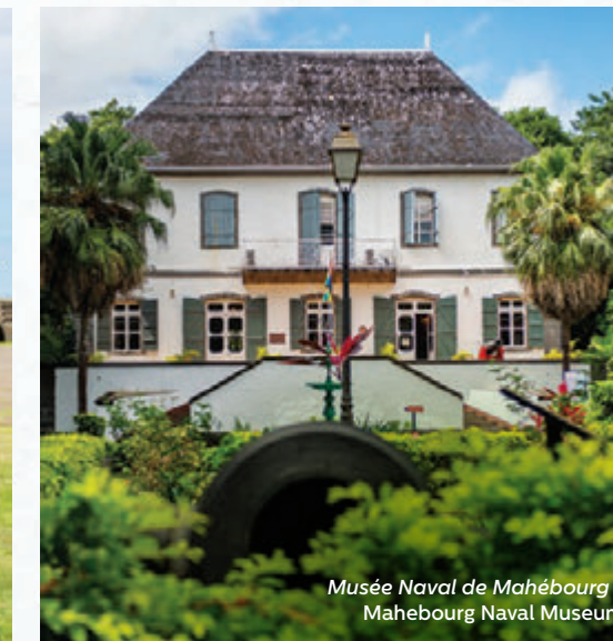
Musée Naval de Mahébourg - Mahebourg Naval Museum

Bienvenue dans le berceau de l'île Maurice, une région au patrimoine dense que l'histoire a marquée de son empreinte.