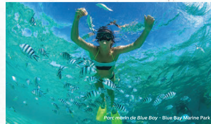
Parc marin de Blue Bay - Blue Bay Marine Park