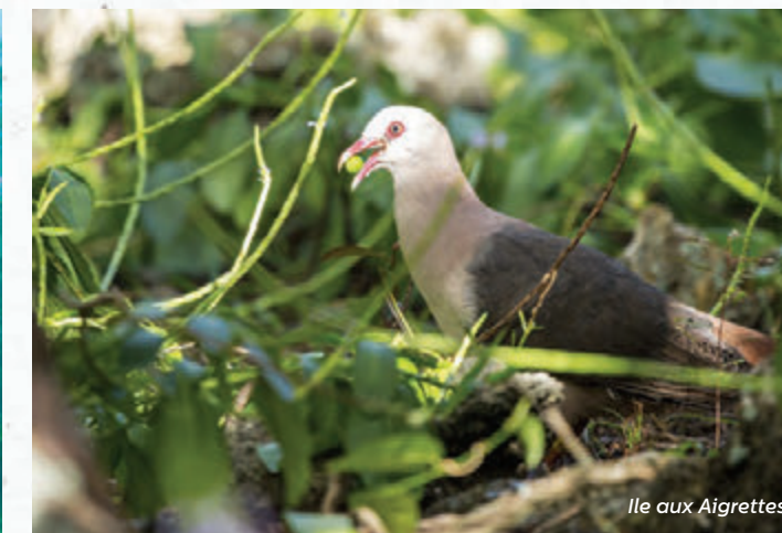
Ile aux Aigrettes

Le projet intégré de Pointe d'Esny Le Village se situe au sud-est de l'île Maurice, au bord d'un des plus beaux lagons du pays.