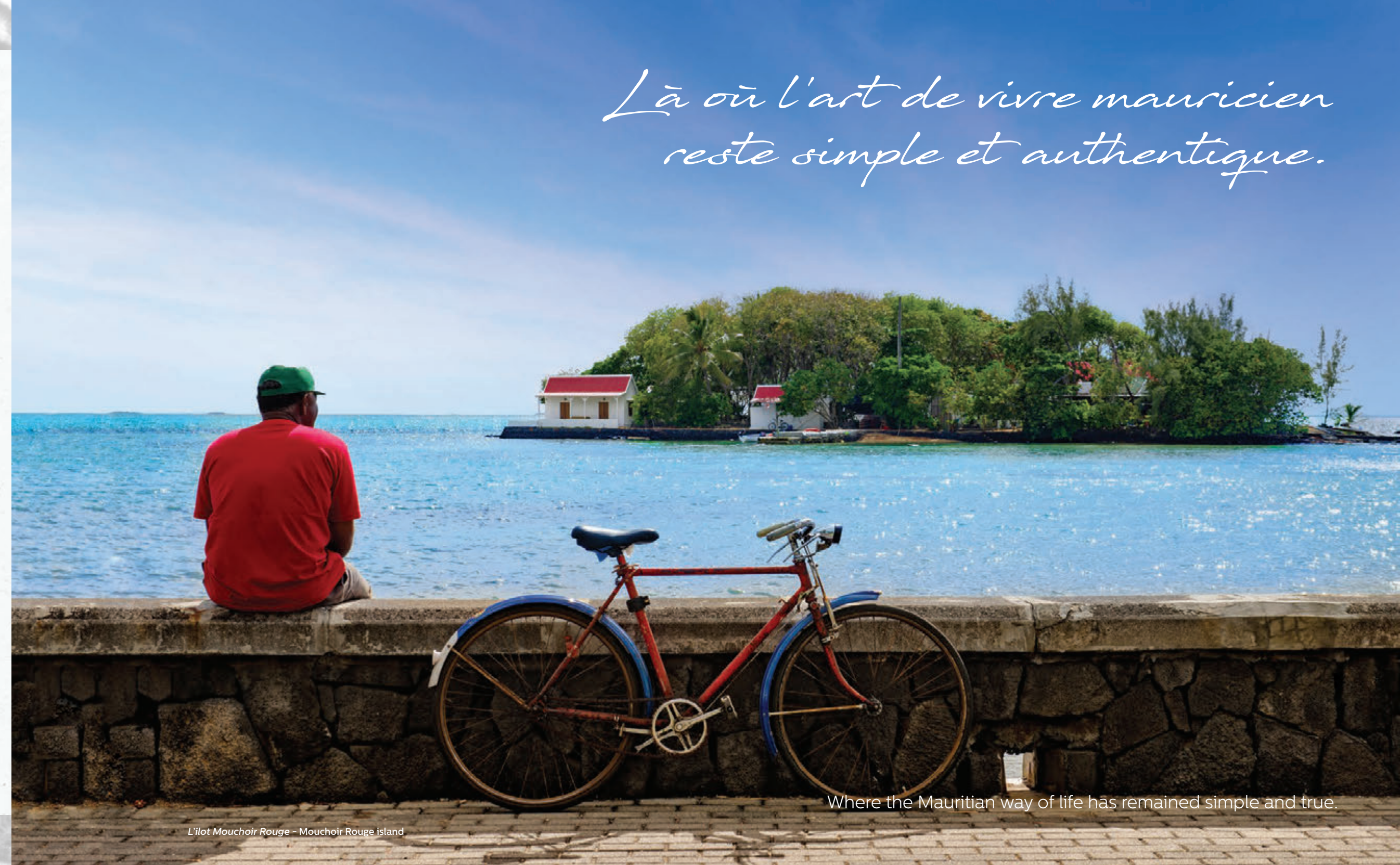
L'îlot Mouchoir Rouge - Mouchoir Rouge island

Là où l'art de vivre mauricien reste simple et authentique.