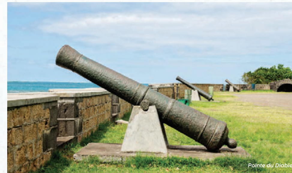
Pointe du Diable

Sur les hauteurs de Riche-en-Eau - On the hills above Riche-en-Eau