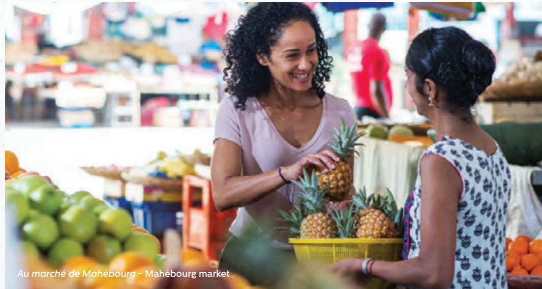
Au marché de Mahébourg - Mahébourg market

Vivre à Pointe d'Esny Le Village, c'est côtoyer un environnement paisible qui permet de se ressourcer au quotidien.