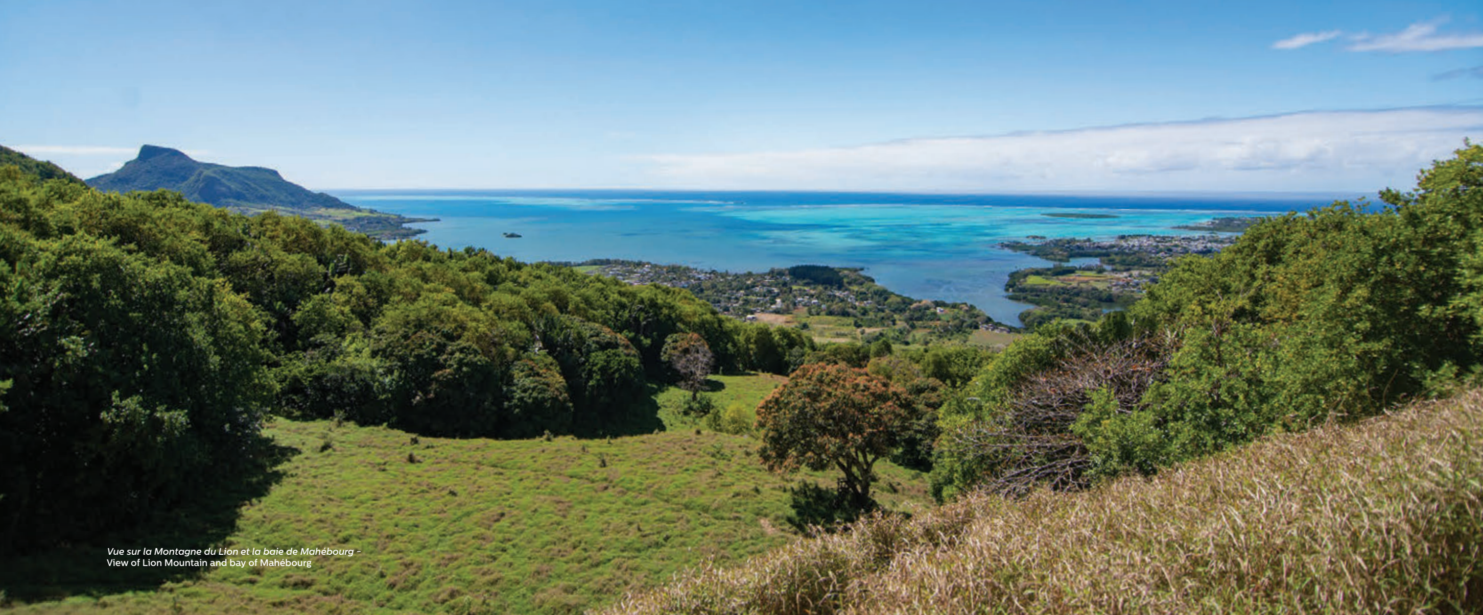
Vue sur la Montagne du Lion et la baie de Mahébourg - View of Lion Mountain and bay of Mahébourg

Discover Mauritius' southeast and its lush, natural charms.